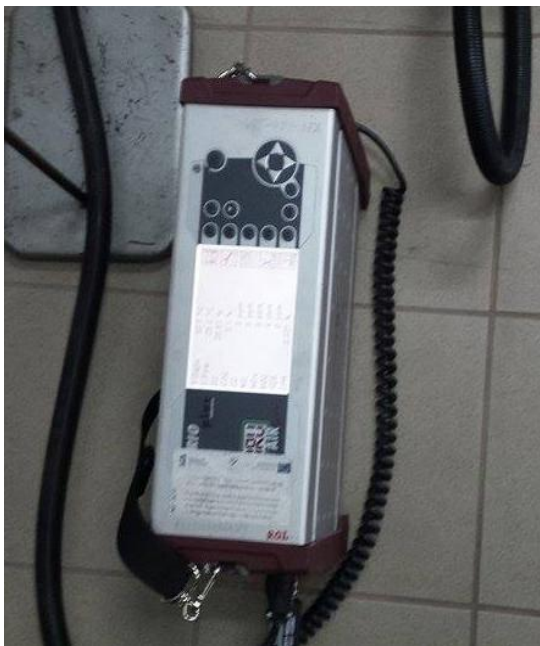
Rysunek 3. Widok analizatora spalin MRU Vario Plus IV.