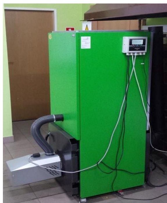
Rysunek 2. Widok kotła grzewczego mini BIO.

W Tabeli 1 zestawiono średnie wyniki pomiarów zawartości popiołu, wilgoci oraz ciepła spalania, wartości opałowej